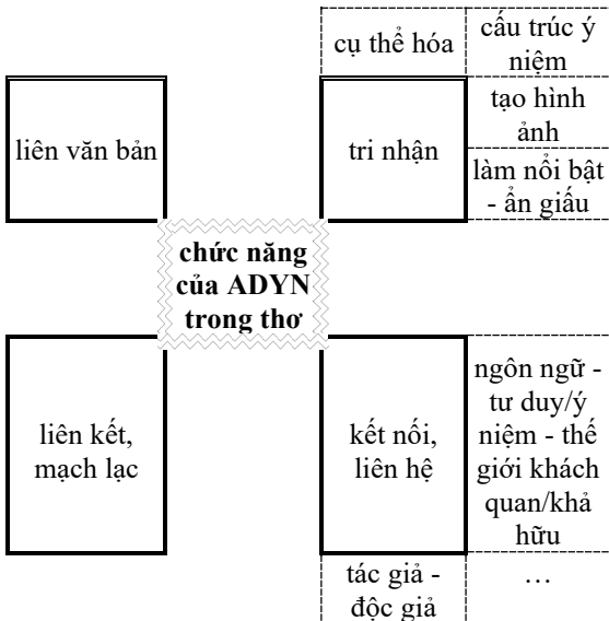
Hình 2. Chức năng của ADYN trong thơ

Như vậy, để khu biệt chức năng của ADYN trong thơ, chúng tôi khái quát lại như Hình 2 bên dưới. Trong đó, chức năng tri nhận là chức năng chính yếu của ADYN nên là chức năng chung ở tất cả các lĩnh vực. Tuy nhiên, trong thơ, chức năng này có những nét đặc trưng riêng biệt.